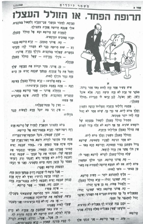
"תרופת הפחד, או הזולל העצלן", משמר לילדים, 1.12.1949

הביקורת על אכילה חסרת איפוק מופיעה שוב ושוב בתיאורים של גרגרנות וגרגרנים, ומקושרת לשורה של תכונות שליליות. כך למשל במשמר לילדים מובא סיפורו של אדם שמן מאוד, המכונה "הזולל העצלן", שסירב להפסיק לזלול. כל הרופאים נואשו מלטפל בו, מפני שכפי שטען בעצמו, "המאכלים כל כך טעימים ומגרים את תאבוני. ואינני יכול להתגבר על עצמי". אחד הרופאים מחליט להערים עליו באומרו שגורלו נחרץ והוא עתיד למות תוך שבוע. מרוב פחד מאבד הגרגרן העצלן את תאבונו ומצליח לרדת במשקל (וללא שום), "תרופת הפחד, או הזולל העצלן", משמר לילדים, (1.12.1949).