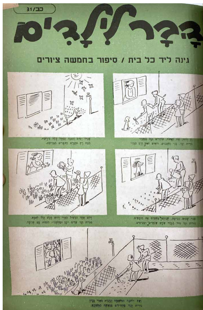
"גינה ליד כל בית", שער מאויר, דבר לילדים, 23.4.1952

בעיצומו של המשבר הכלכלי בשנת 1951 החל להתפרסם בהארץ שלנו טור חדש בשם "עשה לך גינה", שלימד את הקוראים כיצד לגדל ירקות ופירט את רשימת הכלים הנדרשים לגינון (ללא שם, "עשה לך גינה", הארץ שלנו, 12.9.1951). טור אחר הסביר כי לאור החשש ממחסור במזון כתוצאה מהגידול במספר העולים, יש חשיבות רבה לגידול עצמאי של ירקות. הכותב סיפק לקוראים הנחיות מפורטות כיצד לגדל ירקות כמו כרובית, אפונה, כרוב אדום וקולרבי, וכיצד לטפל בירקות שנשתלו ולהשקותם: "שקרו על עבודת הגינה! ספקו את תצרוכת המשפחה בירקות, ואמא לא תצטרך לעמוד בתור,